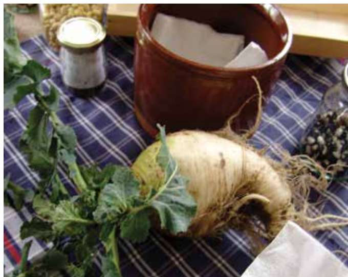
Autoproduzioni da scambiare sul tradizionale mandillo, Torriglia 20 gennaio 2008

il Mandillo dei Semi si svolgerà la premiazione del concorso letterario "Parole di Terra", promosso da Pentàgora Edizioni ed esclusivamente dedicato al mondo rurale. La seconda riguarda l'organizzazione di mostre di cereali, ortaggi e frutta, collaterali al Mandillo curate dalla Rete Semi Rurali. Tra le altre mostre si attendono una collezione di 350 varietà storiche di patata, 600 varietà di peperoncino, la collezione dei frumenti tradizionali conservati nei campi-catalogo promossi dalla Rete.