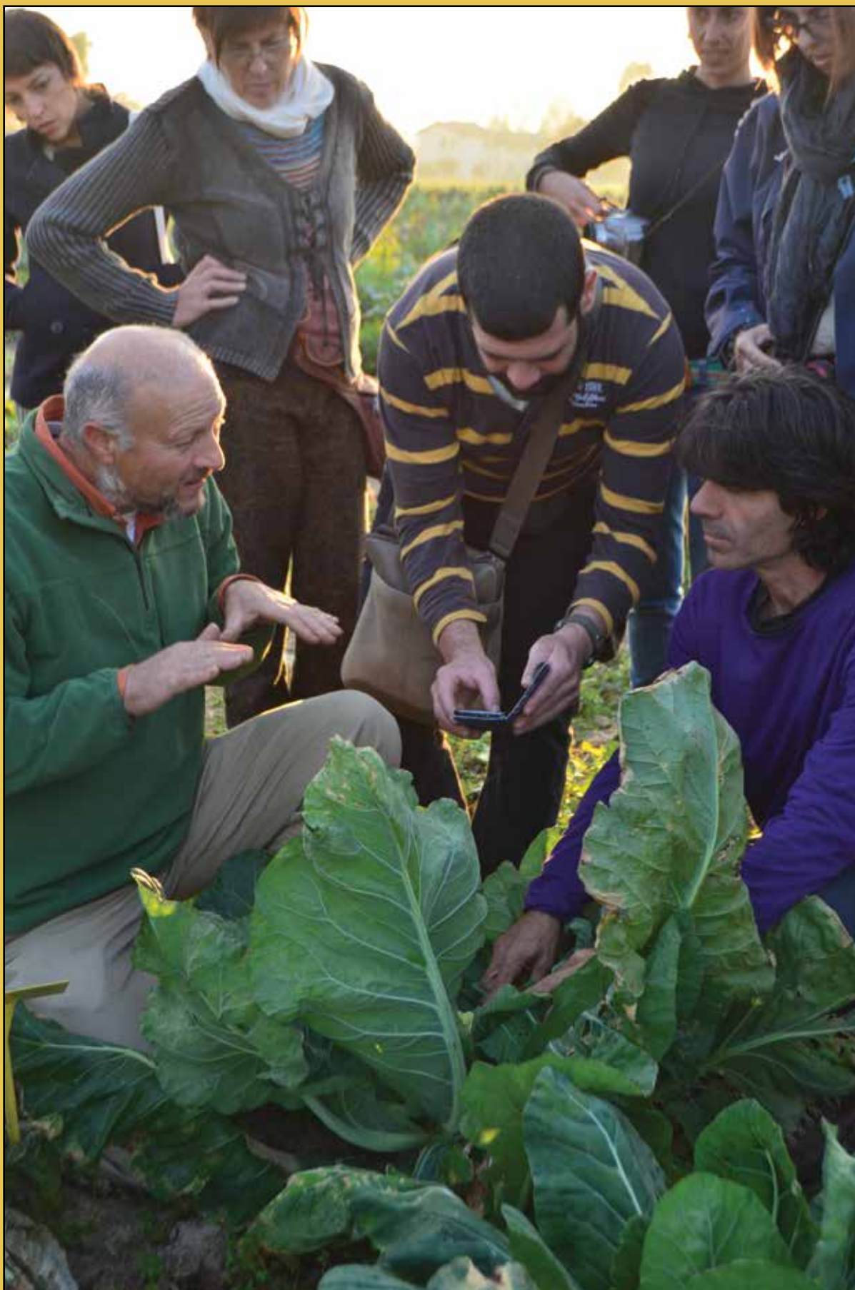
Visita Leonardo GROW in Veneto sulla coltivazione e selezione di radicchio e broccoli, 29 ottobre-1 novembre 2014