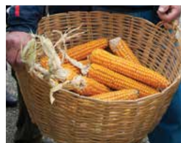
Seminlibertà, Barisciano 28 novembre 2014

Il seme simbolicamente rappresenta la vita, non solo quella della pianta che esso genera, ma più in generale la vita dell'uomo sulla terra e in quanto tale ciascuno di noi ha il compito di preservare i semi per se stesso e per le generazioni future.