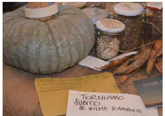
Mandillo dei semi, Torriglia, 19 gennaio 2014